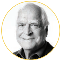
Pr. Dr. Peter Eigen